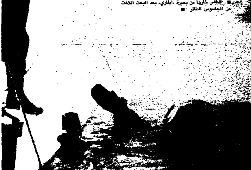
غطس فنلندي تحت سطح الجليد ليلقط الحطام والشظايا